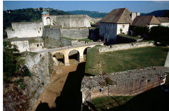
Citadelle de Besançon