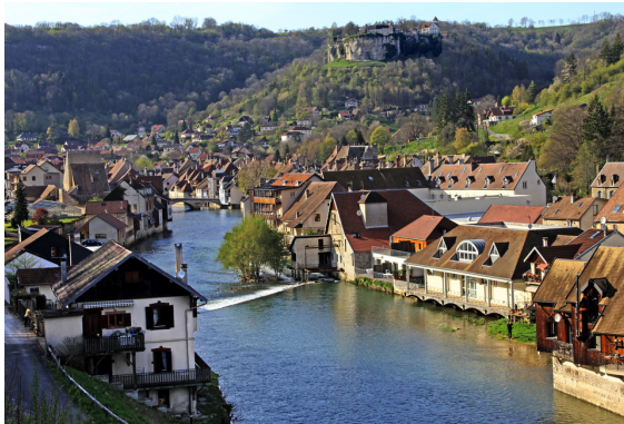
Ornans Loue Chateau